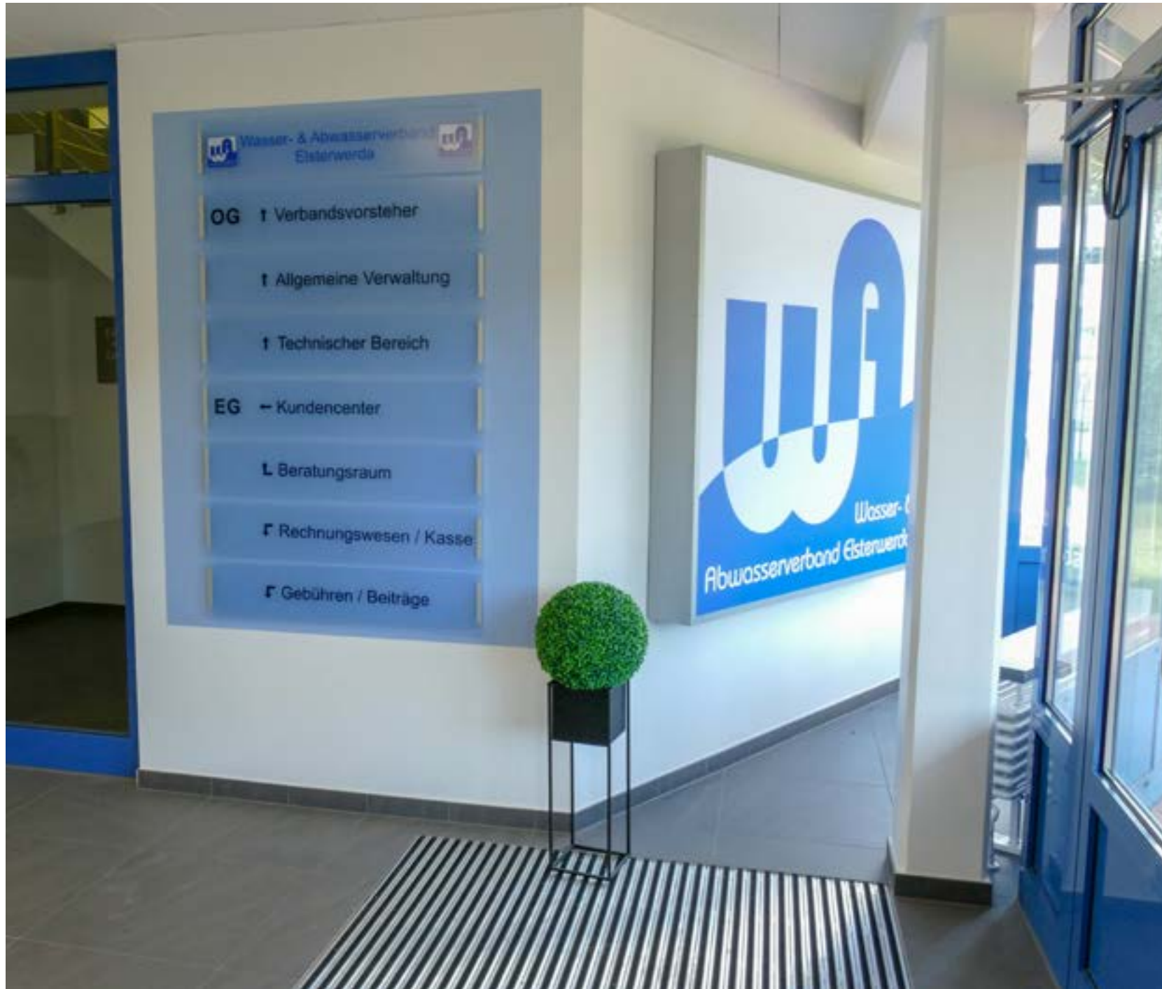
Heller und freundlicher Empfangsbereich mit Leuchtschilderung und Bepflanzung.