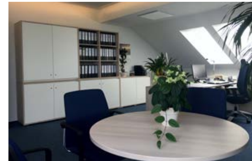
Hochwertiges Geschäftsführerzimmer mit ausreichend Ablagemöglichkeiten.