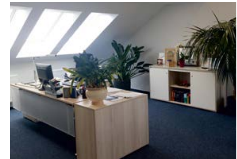
Geschäftsführerzimmer mit einer repräsentativen Ausstattung.