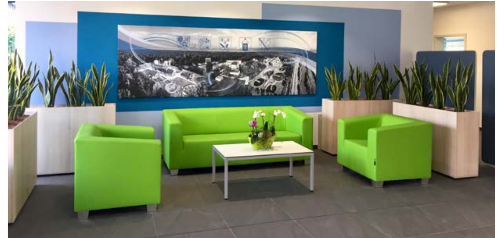
Stilvoller und farbenfroher Empfangsbereich mit bequemen Loungemöbel.